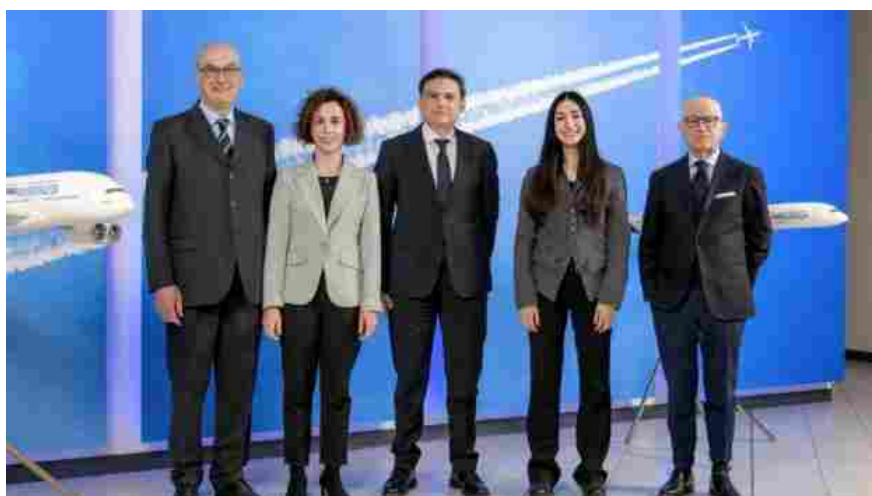
L'azienda celebra il traguardo con grande enfasi