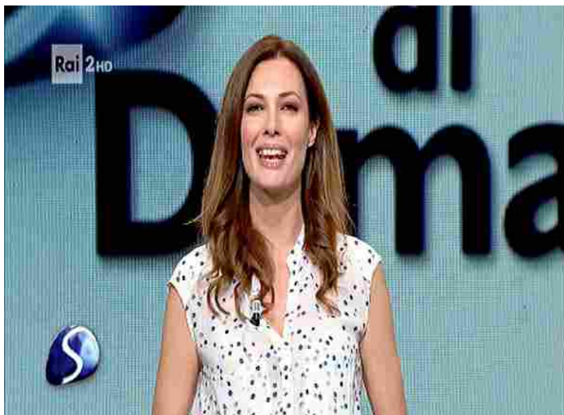
Anticipazioni per "Sulla via di Damasco" del 29 marzo alle 9 su RAI 2: ripensare l'economia del domani