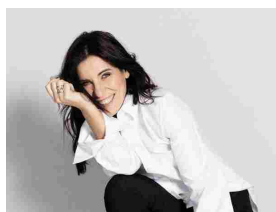
Paola Turci in "Viva da Morire Tour" giovedì al Teatro Celebrazioni di Bologna