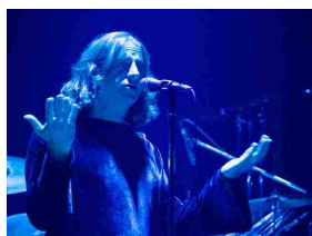
The Musical Box giovedì all'Europa Auditorium di Bologna