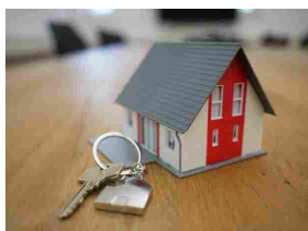
Fisco, in Galleria Europa a Modena si parla di agevolazioni per la prima casa