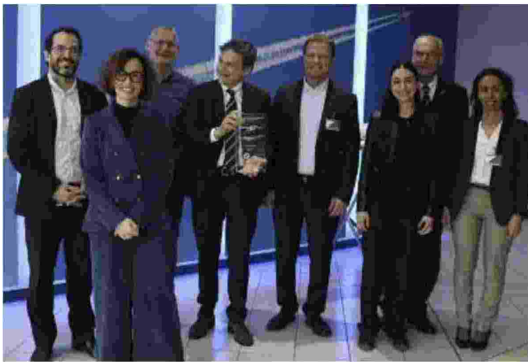
Il riconoscimento è arrivato per la realizzazione di una nuova architettura di attuatore rotativo