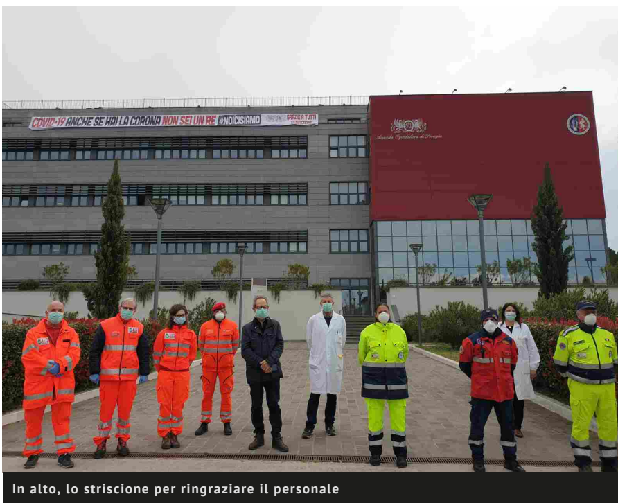
In alto, lo striscione per ringraziare il personale

Dai 5 ai 20 mila euro, tanta solidarietà per il Santa Maria. Medici, Oss e infermieri per i reparti più sotto pressione